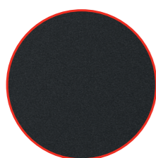
Hladký povrch [F]

V súčasnosti sú modulárne strešné panely FIT v našej ponuke dostupné v troch povrchových úpravách: hladká [F], MICRO RIB [M].