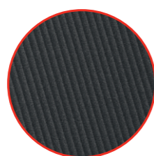
Profilovanie MICRO RIB [M]